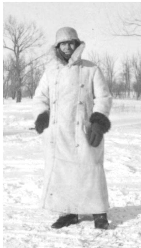
Deutscher Vorposten vor Kiev im Frühjahr 1942: Die Winterausrüstung erreichte die Truppe hier in Form eines Lammfellmantels (PH)

Die Verteilung der produzierten Rüstungsgüter wurde zum Transportproblem. Die Ausdehnung des Raums hatte riesige Dimensionen erreicht. Lokomotiven und Rollmaterial wurden zu Engpässen. Ein grosses Lokomotivprogramm sollte Abhilfe schaffen xiii .