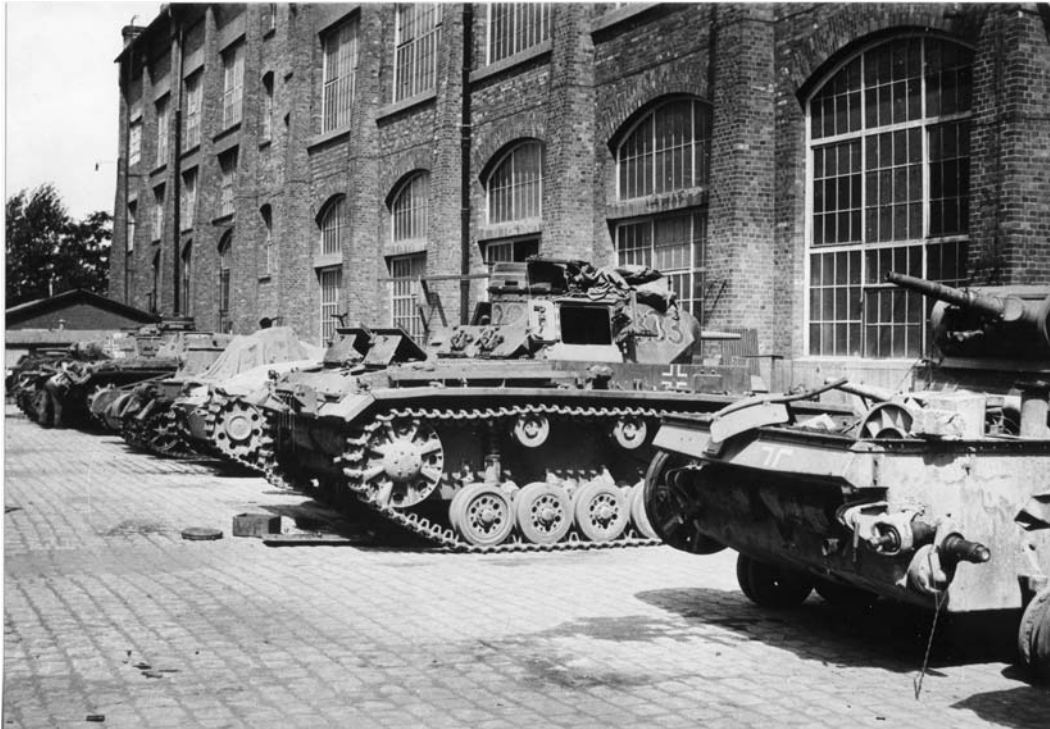
Hinter der Halle im Werk Berlin-Marienfelde der Firma Daimler Benz im Jahr 1940: Schadfahrzeuge warten auf ihre Instandsetzung oder ihre Ausschachtung. Sichtbar sind (von vorne nach hinten) 2 PzKpfw III Ausf F, 1 Wanne PzKpfw III Ausf E, 1 Fahrzeug 4,7cm Pak (t) (Sf) auf PzKpfw I Ausf B, Kleiner Panzerbefehlswagen I Ausf B, 3 weitere PzKpfw III Ausf E oder F (DC)

Ebenfalls wurde die Gelegenheit zur Nachrüstung angeordneter Kampfwertsteigerungen ergriffen, so zum Beispiel der Einbau von Zusatzpanzerungen, oder stärkerer Bewaffnungen. So entstanden interessante Mischtypen, welche ähnlich der Truppenumbauten eine Analyse des Bilddatums schwierig machen.