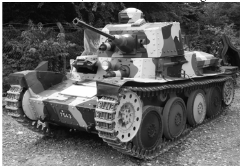
Reuenthal 2003 (SV)