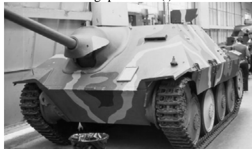
Bovington 1980 (SV)

Unter dem Titel „Abarten“ dargestellt sind: