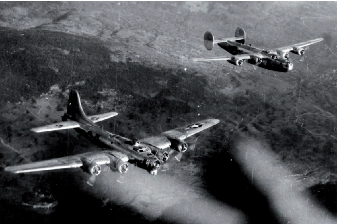
Eine B-17 G und eine B-24 H auf dem Rückflug von ihrem Angriff auf Ziele in Wien am 7.X.44. (HF)

Diese Batterie, die 7./533, war Teil des Flakgürtels in und rund um Wien 36 und fast täglich im Einsatz. Sie wurde im Frühsommer von Wiener Neustadt-Heideacker, wo sie schwere Angriffe zu überstehen hatte, nach Wien verlegt um weiter die folgenden starken Angriffe auf die Stadt zu bekämpfen. Sie hatte bereits 33 Abschüsse beziehungsweise Beteiligungen zu verzeichnen, was mit dem Flak-kampfabzeichen gewürdigt wurde und unseren Neid hervorrief. Die 7./533 kam gegen Ende des Krieges, und nachdem alle LwH im März 1945 entlassen worden waren, noch gegen angreifende russische Panzer zum Erdeinsatz und erlitt hohe Verluste.