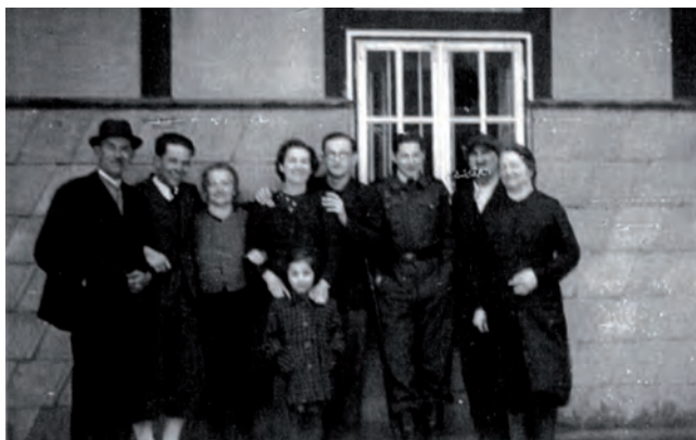
Urlaub zuhause mit Eltern und Verwandtschaft.

Doch auch Langurlaube gingen einmal zu Ende – Freitag, 8.IX.44: „Der schöne Urlaub ist zu Ende. Das andere Tagebuch auch. Mir kommt erst jetzt zu Bewußtsein, daß ich zu Hause war. Ich bin zwar schon gestern gekommen, lag statt im Federbett auf dem Holzwollesack und wickelte mich statt in die Tuchent in kratzende Decken. Geändert hat sich nicht viel. Schmutzi ist heute auch gekommen. Machten den Vormittag nicht viel Dienst mit...“