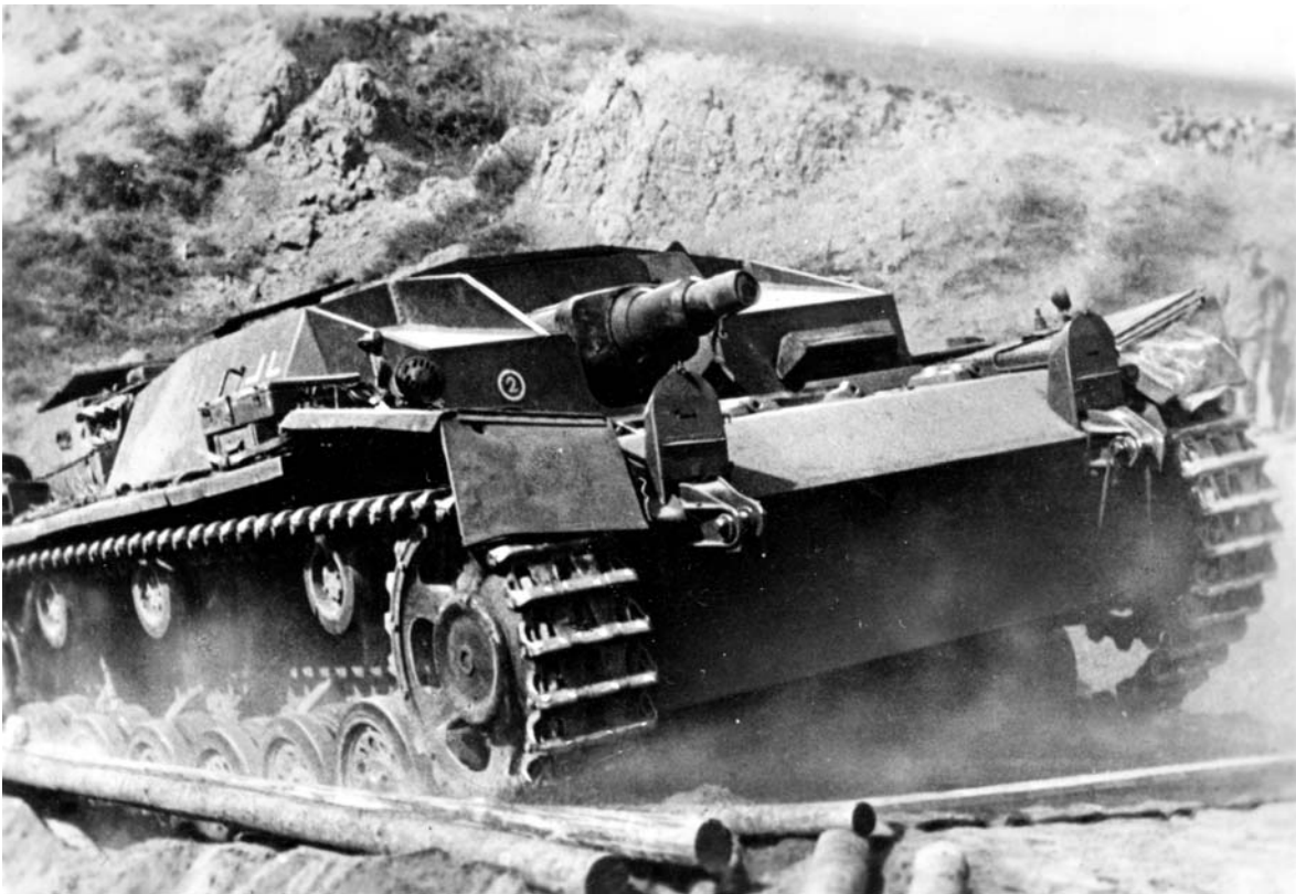
StuG III Ausf C auf einer Knüppelstrasse in Russland / Alkett, 3. – 5.1941

Die ersten Sturmgeschütze gingen im Mai (ein Stück) und im Juni 1941 (drei Stück) verloren, 286 nachher summierten sich die Verluste bei den Sturmgeschützen bis zum Jahresende auf 96 Stück.