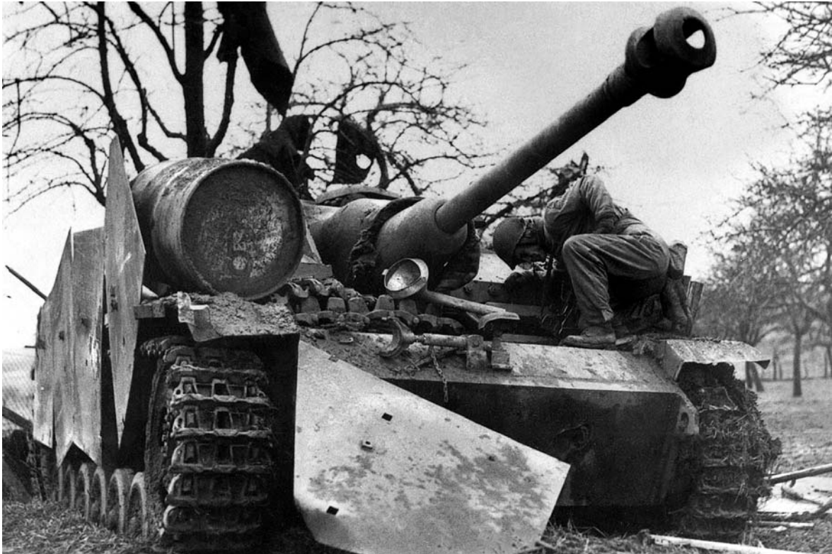
StuG III Ausf G / Ein amerikanischer Soldat schaut das Fahrzeug nach der Ardennen-Offensive an / Durch die Truppe modifizierte Befestigung der Panzerschürzen / Alkett, 9. – 10.1944

Beim Sturmgeschütz III war die Situation etwas komfortabler, da die Fertigungsspitze erst nach der Ausstattung der Truppen für »Wacht am Rhein« erreicht wurde: Anfang 1945 waren noch 40 StuG in den Heereszeugämtern, zusätzliche 139 waren abgenommen und unterwegs dorthin, zehn StuH waren in den HZA und 20 auf dem Weg, was ein Gesamtbestand von 219 StuG und StuH in Reserve war. Dies bei einem Monatsbedarf von etwa 300 Fahrzeugen. Der Krieg war eigentlich vorbei – auch für die Sturmgeschütze.